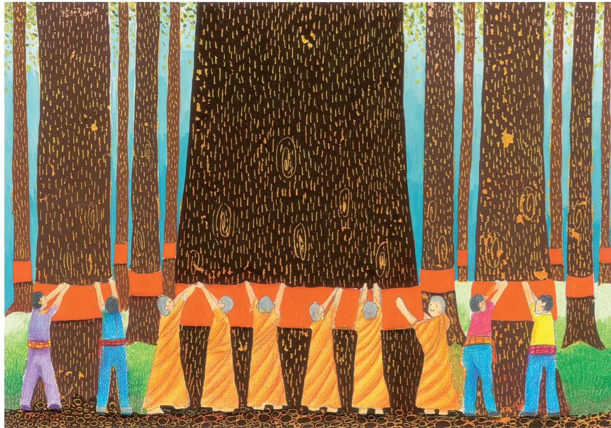
"eco together" – Planet Earth Grand Prix: "บวชป่ารักษาต้นไม้" กชพรรณ มะลิซ้อน (14 ปี)

โครงการประกวดภาพวาดสิ่งแวดล้อมนานาชาติ ระดับเยาวชน โดยคาโอ ครั้งที่ 15