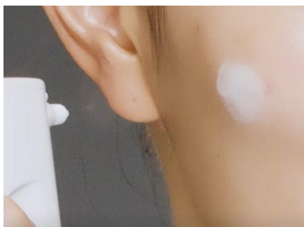
向肌肤喷射形成薄膜