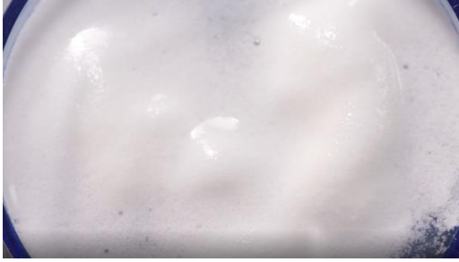
重曹（発泡剤）+クエン酸（発泡剤）によって自発泡する様子