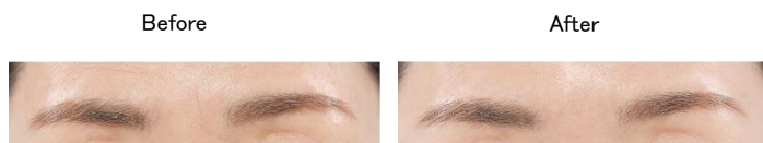
眉間に塗布した場合(イメージ)

発売当初は、ほうれい線のみへの使用を推奨していましたが、発売以降、お客さまから「ほうれい線以外にも使用したい」という声が多くありました。そこで、ほうれい線への検証で得た知見を元に、他部位へ使用するための塗布方法を検討。この度、額のシワ・眉間のシワ・上まぶたのたるみ・目尻のシワ・フェイスラインのたるみ・マリオネットラインの6カ所についても、シワやたるみを物理的に目立ちにくくする効果を確認することができました。