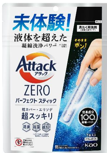
『アタック ZERO パーフェクトスティック 7本入り』