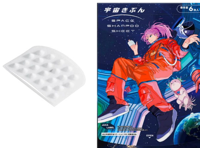
「宇宙きぶん スペースシャンプーシート」左から、商品本体、商品パッケージ

*1「楽天市場」の出店店舗が、新商品や増産前の商品などを企画ページで販売するしくみ