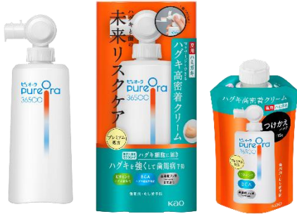
PureOra36500 薬用ハグキ高密着クリームハミガキ【医薬部外品】 (販売名:ピュオーラ CV)