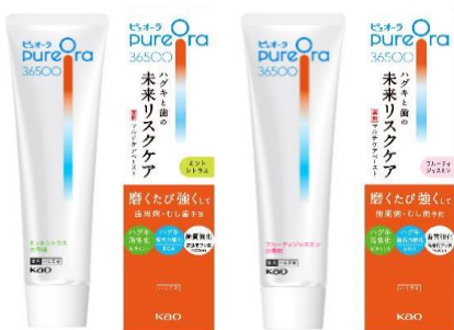
左から PureOra36500 薬用マルチペースト【医薬部外品】 ・ミントシトラス (販売名:ピュオーラ Vb1) ・フルーティジャスミン (販売名:ピュオーラ Vb2)