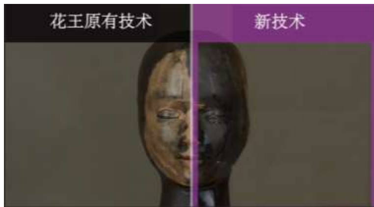
视频：仅靠涂抹即可卸妆的新技术（比较运用不同涂抹方法的卸妆状况）

利用这一技术，涂抹瞬间就能溶解化妆品，用水冲洗时，水会立刻渗入到肌肤与化妆品之间，让卸妆更简便。