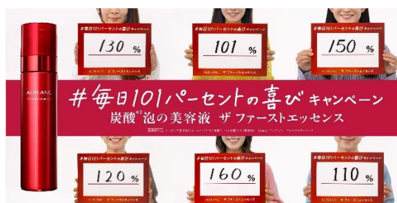
SNS キャンペーン“ザ ファーストエッセンスで、毎日101パーセントの喜びを積み上げていこう”

さらに、新しい生活様式における消費者の購買行動の変化に対応し、2023年春よりオンライン接客をスタートする予定です。オンラインとオフラインの垣根を超えた活動でブランドファンづくりを推進していきます。