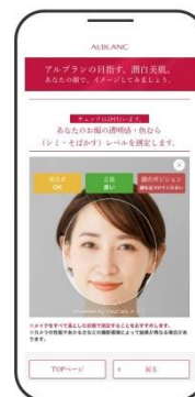
「潤白美肌シミュレーション」 イメージ