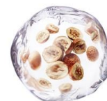
センレンシエキス イメージ

ンシエキス(保湿)」を、『アルブラン ザ ファーストエッセンス』(医薬部外品)にも配合しました。「センレンシエキス(保湿)」は、「トウセンダン」の果実から抽出した花王独自の保湿成分です。花王生物科学研究所が、「乾燥に悩む世界中の人々に寄り添いたい」「今後の花王グループの柱となるオリジナル保湿成分を開発したい」という思いから2007年に研究を開始。14年もの歳月をかけて、約1,600種の植物系素材から厳選し、「ALBLANC」に配合しました。角層のすみずみまで潤いで満たし、くすみ感のない透明感のある肌に導きます。また、毛穴より小さいクリーミーな炭酸* 2 泡が、心地よく肌になじみます。お手入れのファーストステップに使用することで、うるおいで肌をやわらげ、次に使う化粧水のなじみをよくします。