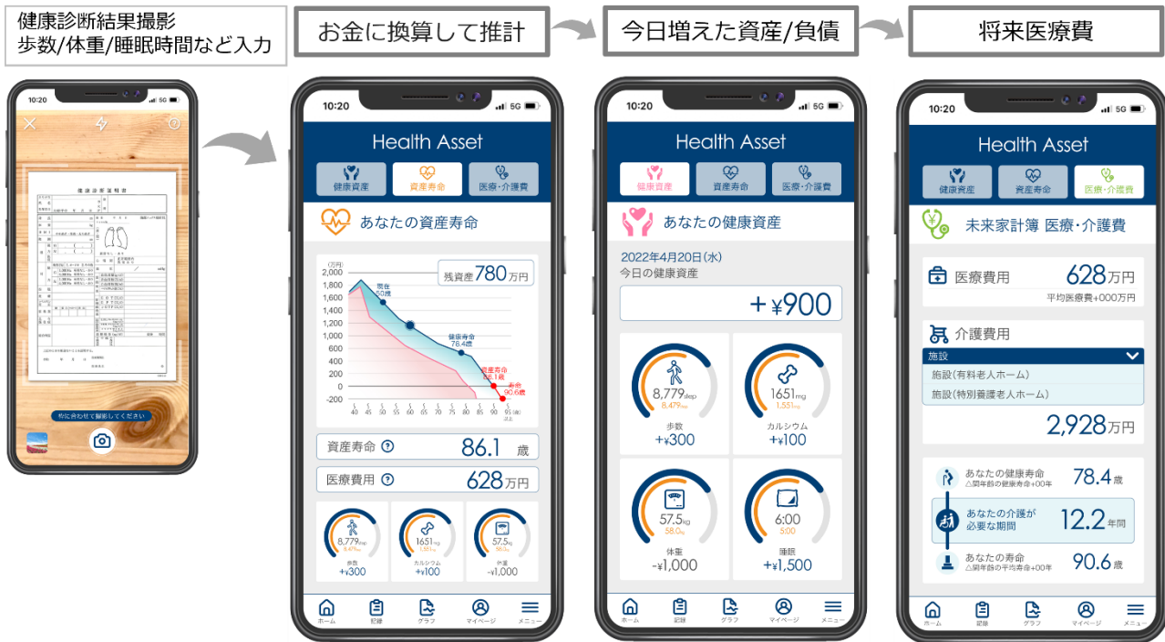
「AI 健康可視化ツール」の操作画面イメージ