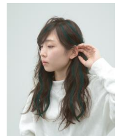
図2. ⑦緑系を施した写真

赤系や青系、紫系などの12色（図1）をそれぞれ使用し、髪色がナチュラルブラウン *1 の女性にデザインカラーを施した写真12枚を用意しました（図2）。10名の20代女性に写真を見せ、「フェミニン」「キュート」「モード」「ゴージャス」の印象 *2 を、各写真からどのくらい感じるか、「全くそう感じない」を0点、「非常にそう感じる」を100点として評価してもらいました（Visual Analogue Scale法）。