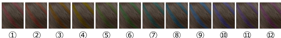
図1. デザインカラーに使用した12色