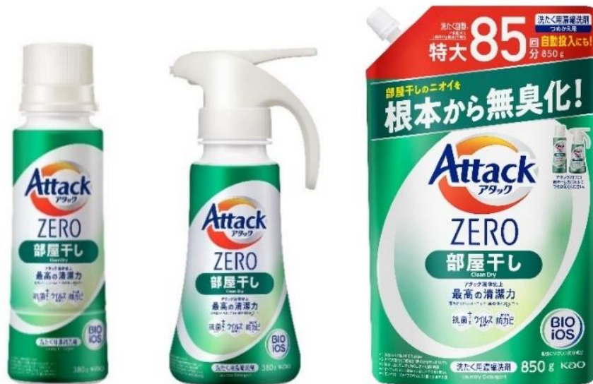
「アタック ZERO(ゼロ) 部屋干し」 左から ボトルタイプ(380g)、ワンハンドプッシュタイプ、つめかえ用(850g)