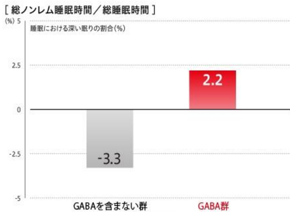
睡眠の質(眠りの深さ、すっきりとした目覚め)の改善