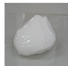
図2 今回開発したぷるぷるのゲル

今回、花王独自の素材 *1 を用いて、高分散した粉体を包み込むことができるぷるぷるのゲル（図2）を形成させる技術を開発しました。このゲルは、塗布すると肌のように非常になめらかな表面を持つ塗膜となり（図3）、内部に光を充分に取り込むことができます。それにより、しっか