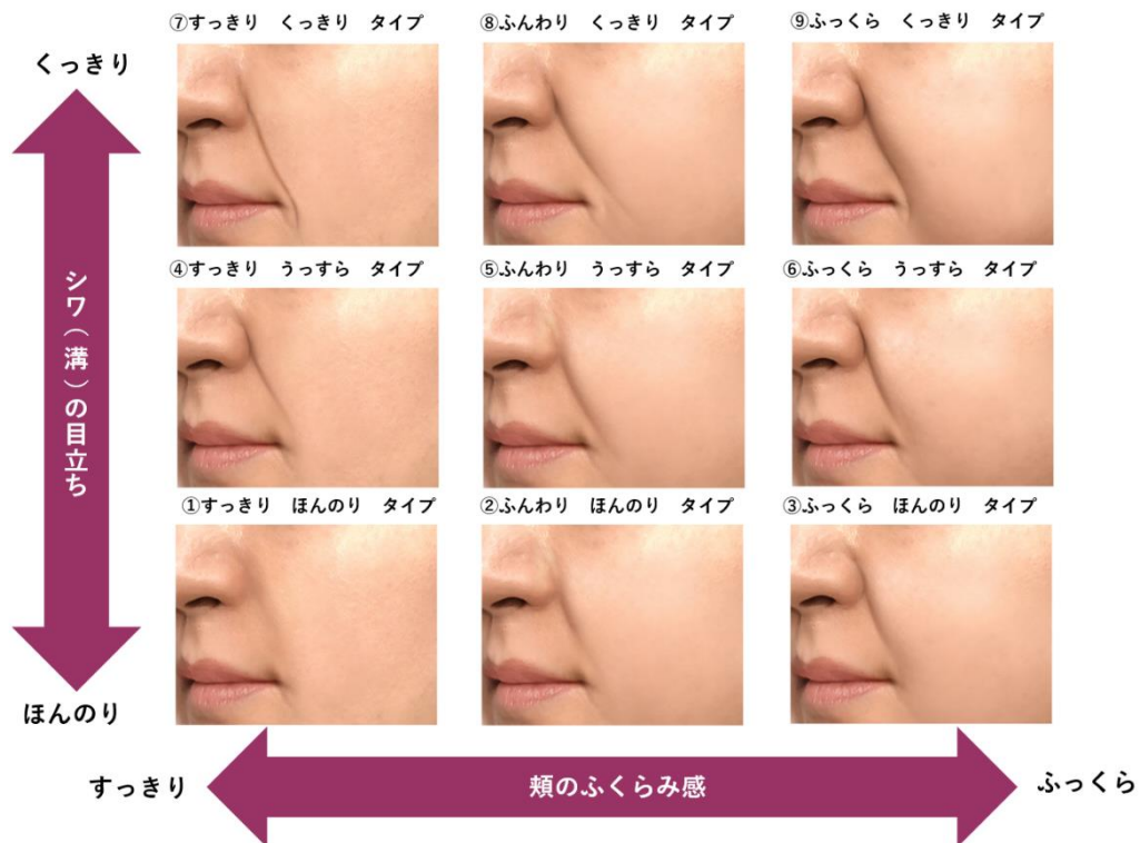
図1 ほうれい線の見え方のタイプ分類(実画像を元に作成したCGイメージ)

本商品をよりキレイに仕上げるポイントをお伝えするために、店頭では使用法や使用上の留意点についての説明を丁寧に行なうなど、きめ細かなカウンセリングを実施します。