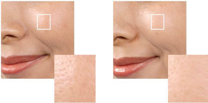
ヴェールメイクメソッドによるメイク

※通常メイク スキンケア品使用后、 「エスト パウダーファンデーション シルキースムース」を使用。 ※ヴェールメイクメソッドによるメイク スキンケア品使用后、 「エスト バイオミメシス ヴェールフィクサーEX」、「エスト バイオミメシス ヴェールポーショ EX」(ヴェールディフューザーにセットして吹きつける)、「エスト パウダーファンデーション シルキースムース」を使用。