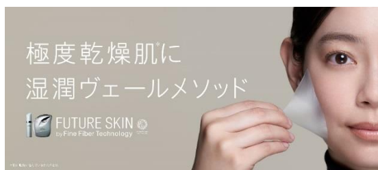
【広告素材(イメージ)】