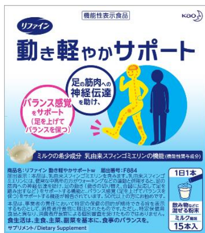
「リファイン 動き軽やかサポート」

ライフケアブランド「リファイン」は、長生きが楽しいと思える社会をめざして、「行きたいときに行きたい場所に自分の力で行ける」「人に会うことや趣味、自分の好きを大切にできる」など、いつまでも自分らしい生活を実現できるよう応援してまいります。