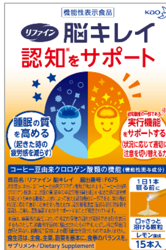
「リファイン 脳キレイ」