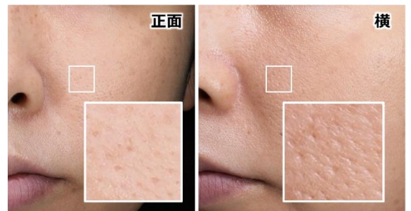
図1. 異なる角度から見たメイク肌のなめらかさの違い

そこで、肌の凹凸そのものを覆ってしまえば、どこから見てもなめらかに見えるのではないかと考えました。