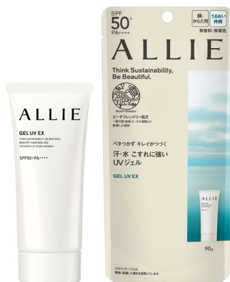
【アリー クロノビューティ ジェル UV EX】