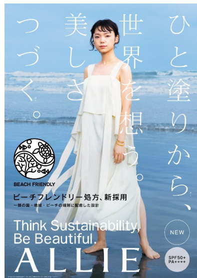
【ブランドイメージ】