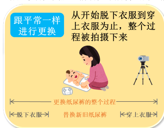
图1 更换纸尿裤时的行为观察

※3 由美国Abidin博士开发的评估家长育儿压力的有效测试工具。该测试在世界范围被广泛使用，能早期发现处于紧张状态下的亲子关系，对减缓压力的早期介入等具有积极作用。测试由孩子角度（从孩子的状态感受到的压力）和家长角度（从自身角度出发感受到的压力）2部分问题构成，针对每个问题，在1-5五个分值选项中进行选择。