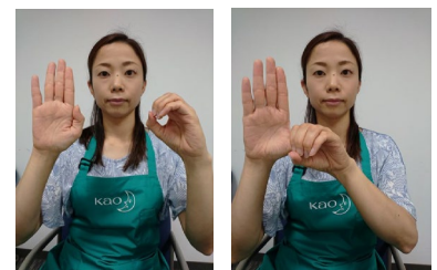
親指をあらうポーズを「指文字」を用いて説明している例

今回、聴覚に障がいがある子どもたちにも、楽しみながら衛生習慣を身につけてもらいたいと考え、「みんなで手あらい ろう学校向け」教材の制作に取り組みました。制作には、聴覚障がいを持つ花王グループ社員を中心とした社内コミュニティ「KAKEHASHI(かけはし)」*のメンバーが携わっています。よりわかりやすく興味を引く教材をめざし、これまで、ろう学校の子どもたちに検証授業を行ない、先生のご意見を伺うといった確認作業を繰り返してきました。そして、手をすみずみまであらうための「6つの手あらいポーズ」の説明に手話の「指文字」を採用するなど工夫を重ね、完成に至りました。