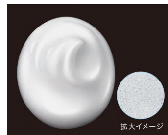
【泡を出した時のイメージ】

今回、その土台美容液で培った炭酸ガスを噴射剤として用いる技術を洗顔料に応用するにあたり、泡質を維持するための処方検討をつみ重ね、洗顔料においても、100%炭酸ガスの噴射剤が作り出す洗浄泡を作ることができました。