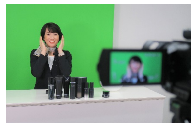
ライブ配信 イメージ

各ブランド共、ライブスタジオを用い、独自の世界観を演出しながら、多くのお客さまに旬の情報を高い熱量でお伝えするライブ配信や、好きな時間にじっくりとお楽しみいただける動画コンテンツの撮影などを予定しています。初めてのお客さまにも気軽にご覧いただける情報発信を頻度高く行なうことで、ブランドとお客さまとの新たな出会いの場を創出します。