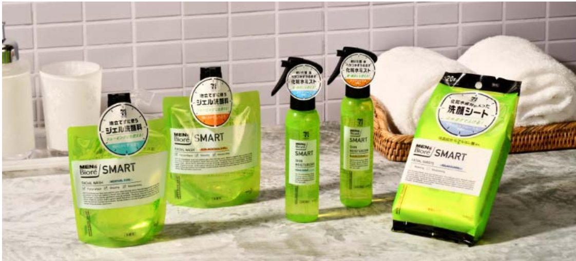
『メンズビオレ SMART ジェル洗顔料』 左から「すっきりタイプ」「しっとりタイプ」

※1 インテージSRI 男性用洗顔料市場 2017年1月～2018年12月累計販売金額 ※2 一部店舗でお取り扱いが無い場合がございます