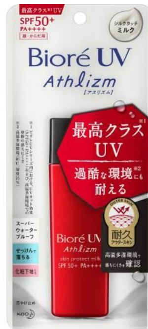
Bioré UV Athlizm skin protect milk