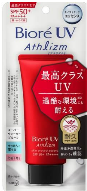
Bioré UV Athlizm skin protect essence

※2 碧柔防晒系列中，防晒效果（SPF50+ PA++++）以及高温多湿环境下涂膜的不易脱落性