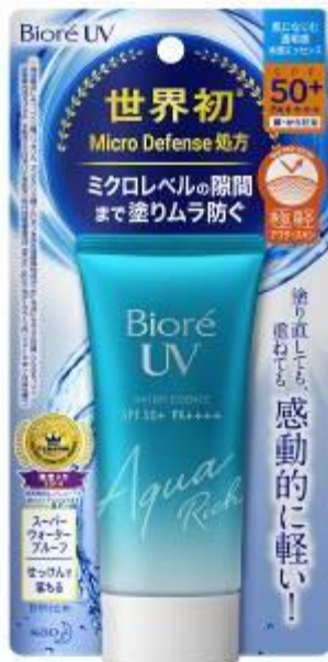
Bioré UV Aqua Rich WATERY ESSENCE

※2 Intage SRI 防晒品市场 2006 年 9 月~2018 年 8 月 各品牌销售数量