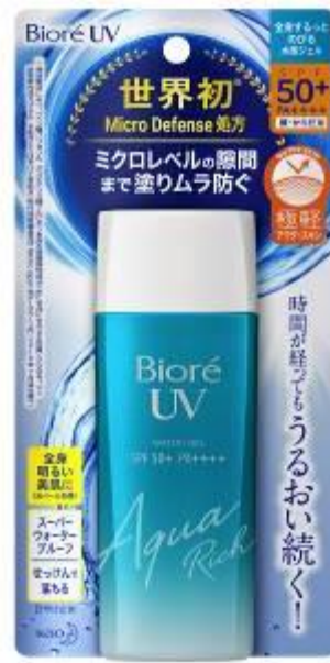
Bioré UV Aqua Rich WATERY GEL