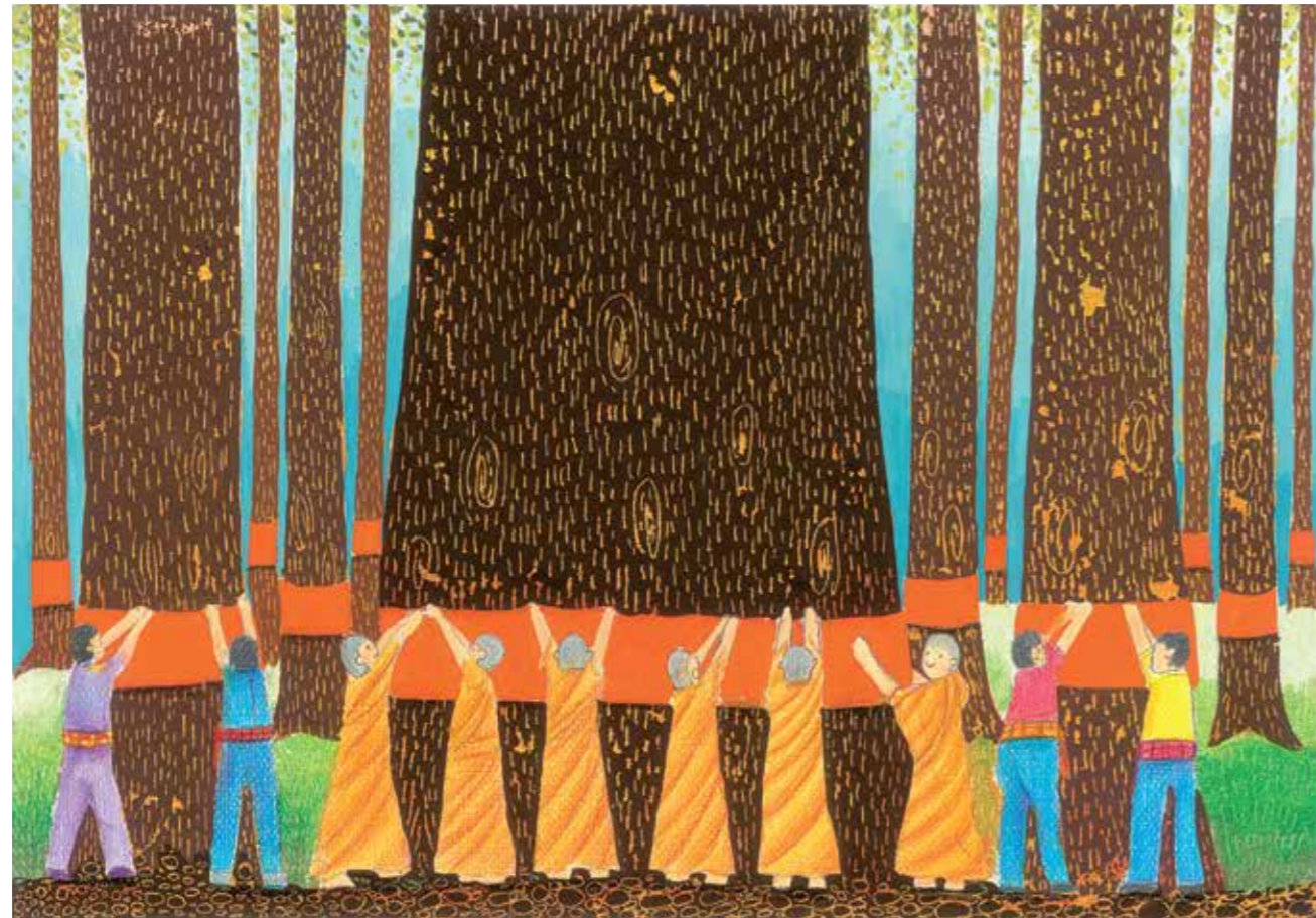
"eco together" - Planet Earth Grand Prix: "Buat Pa" - The Buddhist ritual to conserve forest, Kodchapan Malisorn (14)