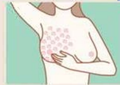
左乳房用右手，右乳房用左手按摩按压。